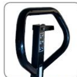
Die ergonomische Deichsel gewährt einen entspannten Griff.