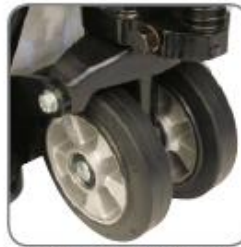
Spezielle Gummiräder schonen empfindliche Bodenbeläge.