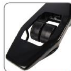
Die Zwillingsgabelrollen sichern optimale Drehbewegungen.