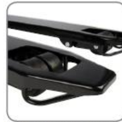
Gleitbügel an den Gabelspitzen ermöglichen ein einfaches und leichtes Hinein- und Herausfahren aus Paletten.