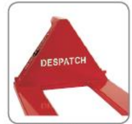
Ausschneiden von Text/Namen/Logo im Dreieck und Sonder-Farbe möglich.