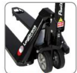
Panther Silent hat permanenten Schnellhub.