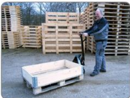
Transport von Gütern im Freien auf losen Untergrund! Mit unserem Panther Silent kein Problem.