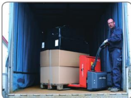
Panther Maxi (Tragkraft 1800 kg) wird für schweren Palettentransport, z.B. für Speditionen, empfohlen.