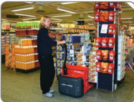
Panther Mini (Tragkraft 1400 kg) wird für leichten Palettentransport, z.B. in Supermärkten und in Lagern, empfohlen.